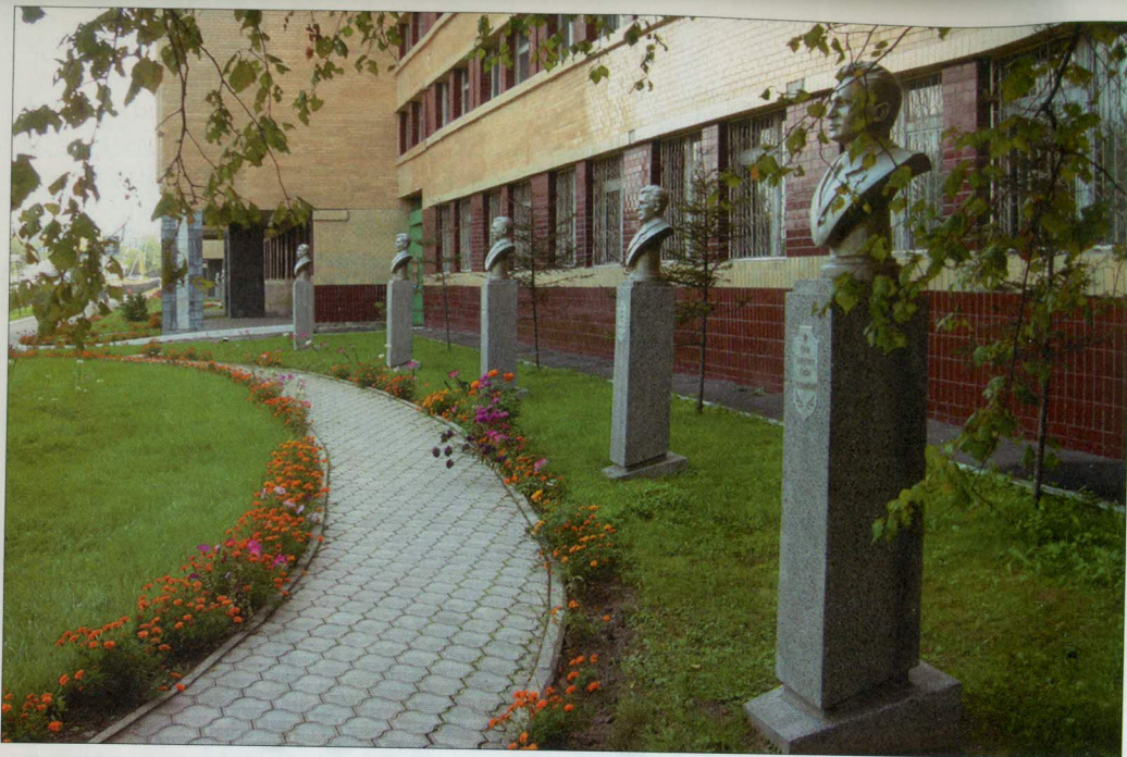
Аллея пограничной славы Хабаровского пограничного института ФСБ России

к этим памятникам цветы. Отдавая дань уважения героям прошлого, воспринимают их как пример для подражания.